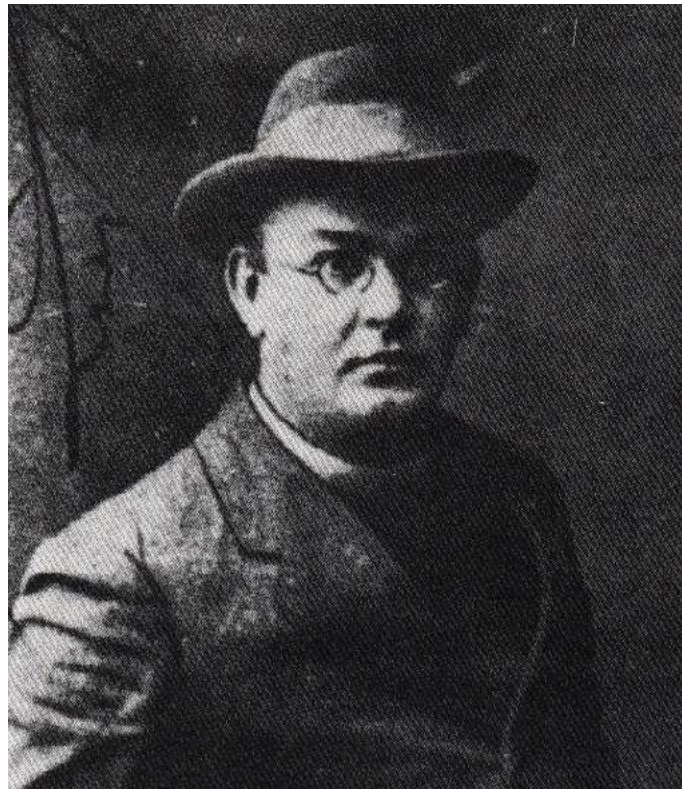
dr. Janez Evangelist Krek