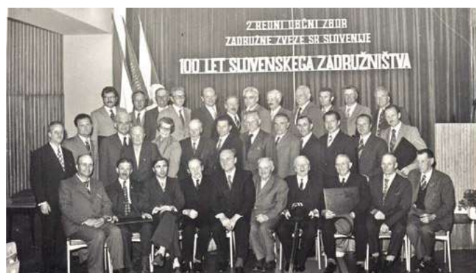
2. občni zbor ZZS leta 1972

Združno gibanje se je na prelomu v 20. stoletje okrepilo in v Krekovem času preraslo v množično gibanje. Nastalo je več poslovnih in revizijskih združnih zvez, leta 1903 tudi združna zveza v Ljubljani. Po prvi svetovni vojni je razvoj združenja zastal, v letih po drugi svetovni vojni pa so zadruge sicer postale opora državnemu gospodarstvu, vendar kolektivizacija kmetijstva s kmečkimi zadrugami ni uspela. Leta 1972 so kmetijske in gozdarske organizacije ponovno ustanovile Zadrुžno zvezo Slovenije.