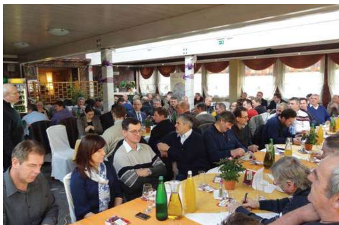
Regijska izobraževanja združnikov Fotografija: arhiv Zadrुžne zveze Slovenije

Zadruge imajo pomembno vlogo pri obveščanju in izobraževanju članov, zlasti tistih, ki opravljajo odgovorne funkcije v upravnih in nadzornih odborih, ter zaposlenih.