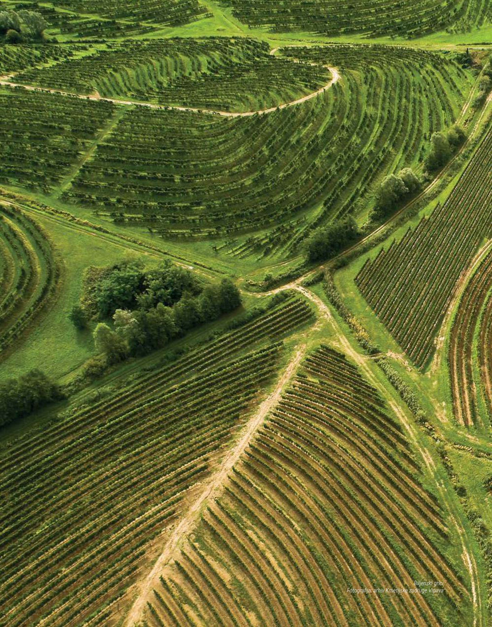
Biljenski griči