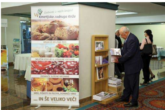
Fotografija: arhiv Zadrुžne zveze Slovenije

Kmetijske in gozdarske zadruge in na splošno organizacije v lasti kmetov vsebinsko predstavljajo organizirane kmete oziroma delujejo kot »podaljšana roka« primarnih proizvajalcev. S tem povečujejo konkurenčnost kmetij in zagotavljajo članom dostop do trga in izravnalno pogajalsko moč. Hkrati realizirajo večje prihranke zaradi večjega obsega poslovanja ter krepijo konkurenčni položaj primarne proizvodnje z inovacijo izdelkov in jamstvom kakovosti ter varnosti.