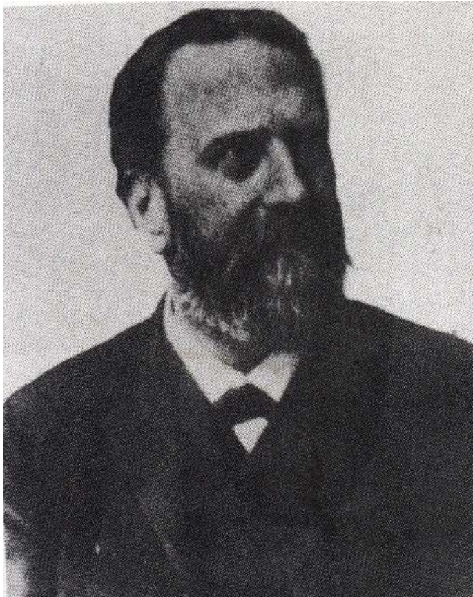
Mihael Vošnjak

Začetki slovenskega združenja segajo v drugo polovico 19. stoletja, ko so na Tolminskem in Bohinjskem začeli ustanavljati sirarske družbe, nato so leta 1872 v Ljutomeru ustanovili prvo kreditno zadrugo in leta 1883 na pobudo Mihaela Vošnjaka v Celju še Zvezo slovenskih posojilnic kot prvo združno zvezo pri nas.