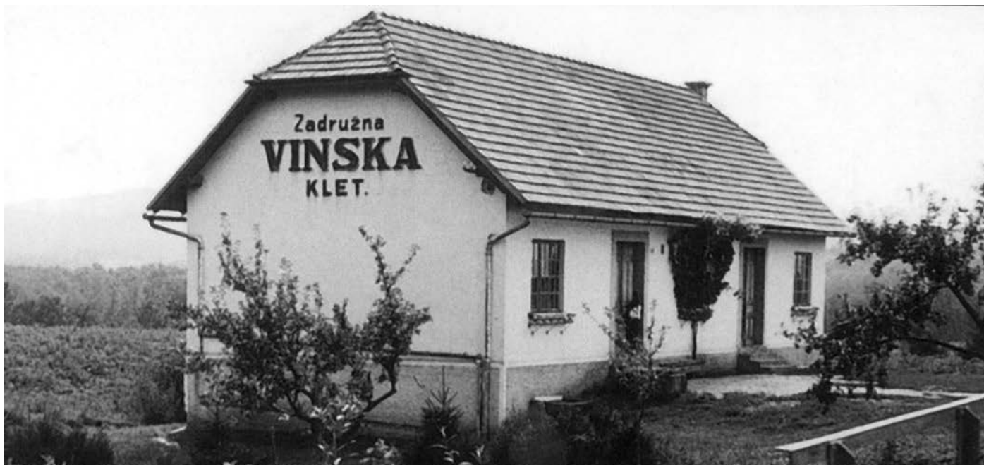
Zadružna vinska klet Metlika

Leta 1992 je bil sprejet nov zakon o zadrugah, ki je urejal postopke za vračilo zadružnega premoženja in udeležbo zadrug v živilskopredelovalni industriji. Zakon se je prvič spremenil v letu 1993, druga sprememba pa je sledila v letu 2007. V letu 2009 je novela Zakona o zadrugah v slovenski pravni red uvedla evropsko zadrugo, ukinila zadružno revizijo ter za domače zadruga prinesla določene novosti o priznanju evropske zadruga.