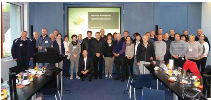
Na obisku pri Zadrudni zvezi Bavarske

Zaposleni v zadrugah predstavljajo skoraj 12 % vseh zaposlenih v skupini držav G20 – to je skupina 20 najpomembnejših razvitih in razvijajočih se gospodarstev, v kateri je 19 držav in Evropska unija. V Franciji 21.000 zadrug zagotavlja več kot milijon delovnih mest, kar je 3,5 % delovno aktivnega prebivalstva. V Združenih državah Amerike je v 30.000 zadrugah zaposlenih več kot dva milijona prebivalstva. V Kanadi je član zadruge vsak četrti prebivalec, na Norveškem je 41 % prebivalstva včlanjenega v zadruge, v Španiji pa je ta delež 15 %.