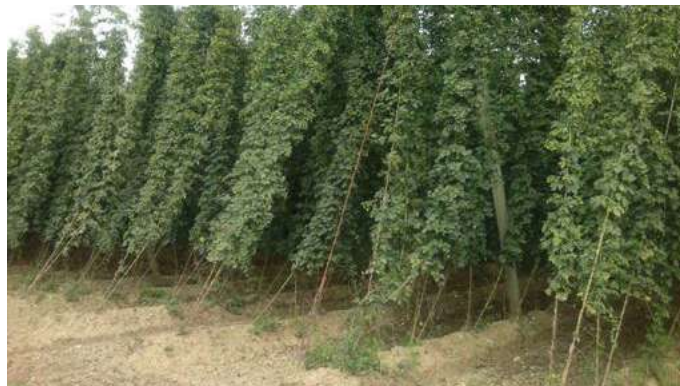
Sušna polja pred namakanjem

bila namakanje in pripeljala vodo do njiv uporabnikov. Investicija se je povrnila že v letu 2013, ko je bilo zaradi suše namakanje potrebno celotno sezono. Z investicijo so zelo zadovoljni tudi kmetje, saj jim v sušnih letih rešuje pridelke in izboljšuje razmere pridelave, hkrati pa zagotavlja stabilnejšo dolgoročno proizvodnjo.