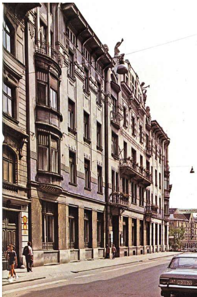
Zgradba Zadružne zveze Slovenije

Slovensko zadružništvo ima več kot 140-letno tradicijo. Zadruga so se v tem obdobju izkazale za učinkovite organizacije, ki povezujejo pridelovalce v ponudbi na trgu, oskrbujejo potrošnike, ohranjajo obdelano in poseljeno podeželje in so gibalno razvoja na podeželju ter pomemben partner slovenske verige preskrbe s hrano.