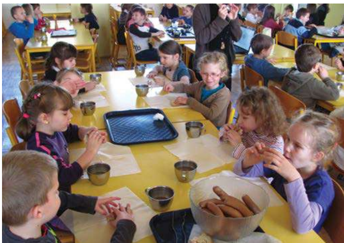
Otroci pri uživanju ekoloških hrenovk Ekodar

Zadruga z izgradnjo blagovne znamke EKODAR, ki je zahtevala veliko vlaganja in dolgotrajni razvoj, zagotavlja sledljivost od pridelovalca do končnega kupca in postaja pomemben dobavitelj ekoloških živil javnim zavodom, šolam, vrtcem in trgovskim verigam. Za svoje delo so bili na natečaju Agrobiznis nagajeni s tretjim mestom, na natečaju, ki ga organizira Evropsko združenje kmetijskih zadrug COGECA, pa so bili uvrščeni med štiri najinovativnejše zadruge v Evropski uniji.