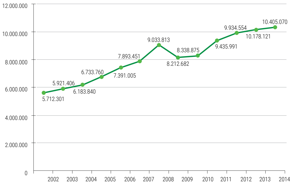
Graf 1: Povprečni prihodek na zadrugo, članico Zadružne zveze Slovenije, v obdobju od leta 2002 do 2014 (v evrih)