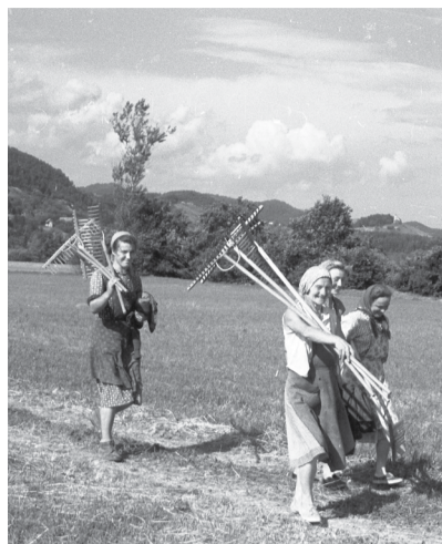
MOTIVI IZ SAVINJSKE DOLINE, JULIJ 1957.

Knjiga je tudi zgodba o ljudeh, ki se niso prepuščali toku zgodovine,