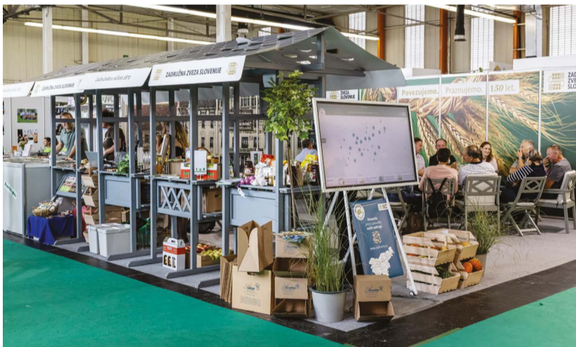
RAZSTAVNI PROSTOR NA SEJMU AGRA 2022