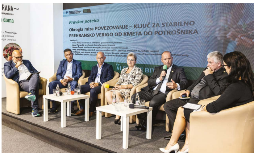
PREDSEDNIK ZZS JE SODELOVAL NA OKROGLI MIZI O PREHRANSKI VERIGI V SLOVENIJI V ORGANIZACIJI MINISTRSTVA ZA KMETIJSTVO, GOZDARSTVO IN PREHRANO.

Zadružna zveza Slovenije vsako leto pomembno sooblikuje dogajanje na Mednarodnem kmetijsko-živilskem sejmu AGRA v Gornji Radgoni, ki je bil letos znova zelo obiskan, kot smo bili vajeni v letih pred omejitvami. Rdeča nit podobe razstavnega prostora in vseh sejmskih dogodkov v organizaciji ZZS sta bila visoka jubileja slovenskega zadružništva. Razstavljalcem in obiskovalcem je bila v času sejma na ogled tudi razstava z naslovom »Zadruga ščitijo prebivalstvo na deželi«. Na razstavnem prostoru ZZS so tudi letošnje leto svojo dejavnost in izdelke predstavile številne zadruga članice, vsakodnevno pa smo sprejeli številne predstavnike državnih in nevladnih organizacij ter poslovnih partnerjev.